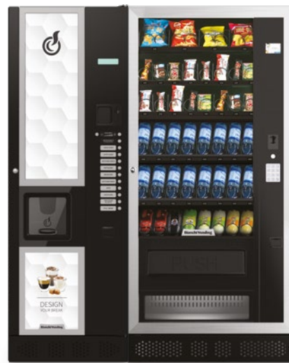
LEI600 + ARIA L MASTER