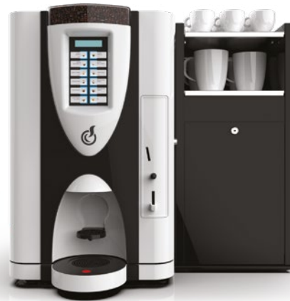
LEI SA RY EASY + MODULO FRESH MILK (accessorio in opzione)

LEI SA RY, en semi-automatisk OCS (Office Coffee Service) maskin som erbjuder kaffe i alla sina olika smaker.