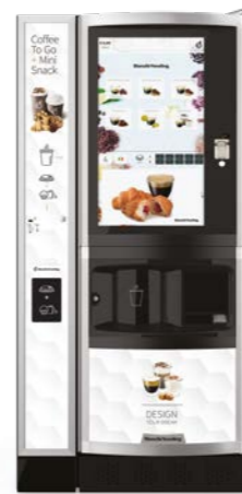
LEI700 PLUS 2CUPS + MODULO COFFEE TO GO

2 dimensioni di bicchieri / 1000 cups / ES / Topping / Coperchi e mini snack integrato / Touch 32"