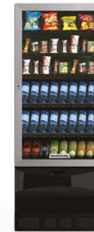
VISTA L (Slave)

6 cassette / 2 colonne / Lift opz. / Display prezzi opz. / Versione con Touch 46"