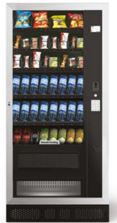
ARIA L EVO

6 cassette / 1 colonna / Display prezzi opz.