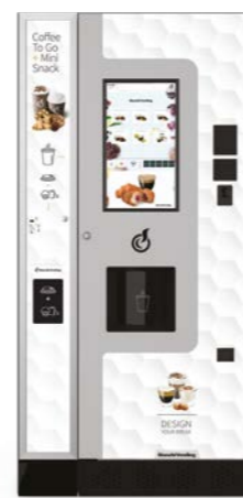
LEI600 PLUS 2CUPS + MODULO COFFEE TO GO

2 dimensioni di bicchieri / 1000 cups / ES e ESV / Topping / Coperchi e mini snack / Touch 32"