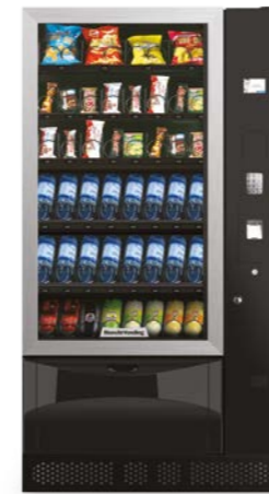
VISTA PLUS L

I distributori di snack e bevande fredde che integrano e completano la tua offerta.