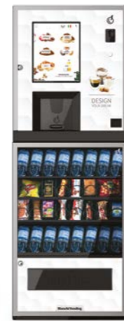
LEI300 EVO 2CUPS + ARIA S

400 cups / ES, ESV e IN / Easy, Smart e Touch 21"