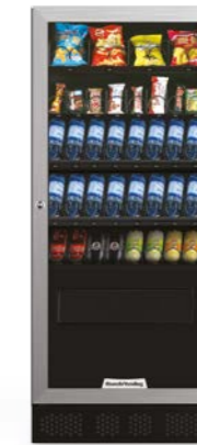
ARIA M (slave)