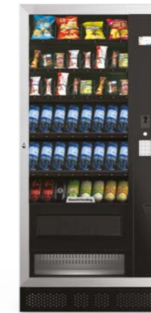
ARIA PLUS L EVO

6 cassette / 1 colonna / Display prezzi opz.