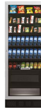
ARIA L EVO (slave)