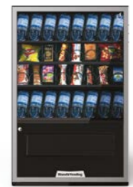
ARIA S EVO