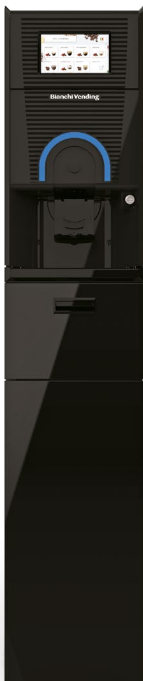
GAIA STYLE RY TOUCH 7" + MÓVEL