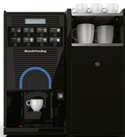
GAIA STYLE RY EASY + MÓDULO PARA LEITE FRESCO (OPCIONAL)

GAIA STYLE RY, máquina semi-automática de bebidas quentes, disponível tanto em café expresso a partir de grão de café como também em versão de bebidas solúveis.