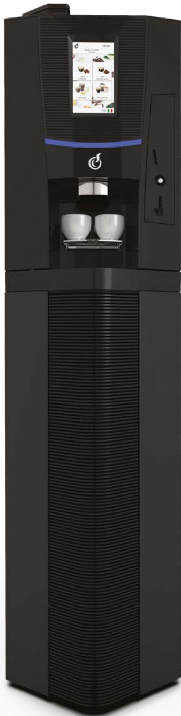
TALIA TOUCH 7* + MUEBLE NEGRO