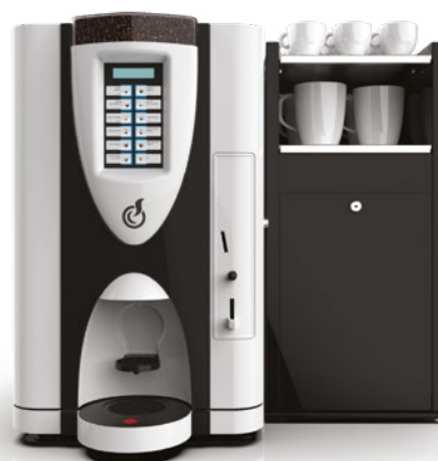
LEI SA RY EASY+ MODULO FRESH MILK (accessorio in opzione)

LEI SA RY, distributore semi automatico OCS (Office Coffee Service) per offrire il caffè nelle sue molteplici declinazioni di gusto.