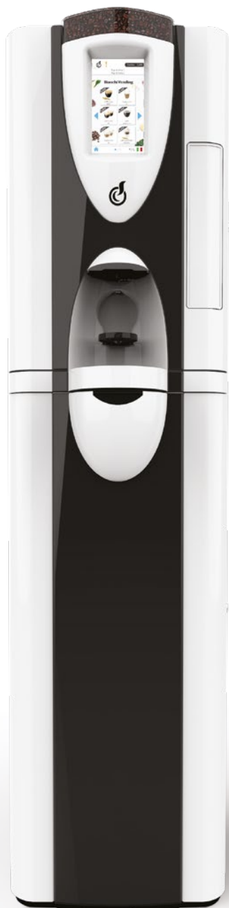
LEI SA RY TOUCH 7" + MOBILETTO