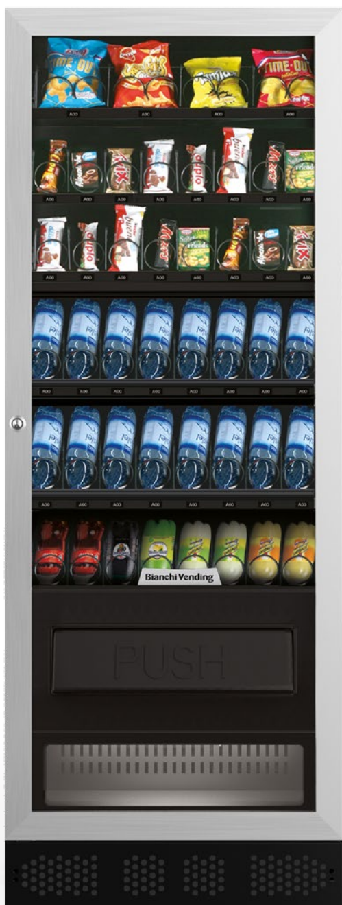
ARIA L EVO SLAVE

ARIA L EVO, distributore automatico a spirali refrigerato per la vendita di snack, panini, prodotti freschi, lattine e bottiglie.