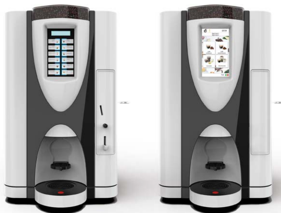
LEI SA RY EASY