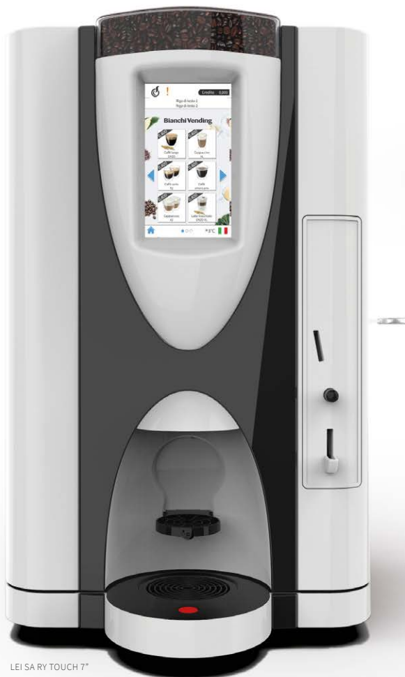
LEI SA RY TOUCH 7"

LEI SA RY, le distributeur semi-automatique OCS (Office Coffee Service) pour une offre café dans toutes ses déclinaisons de goût.