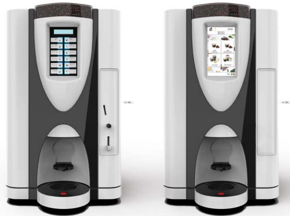
LEI SA RY EASY