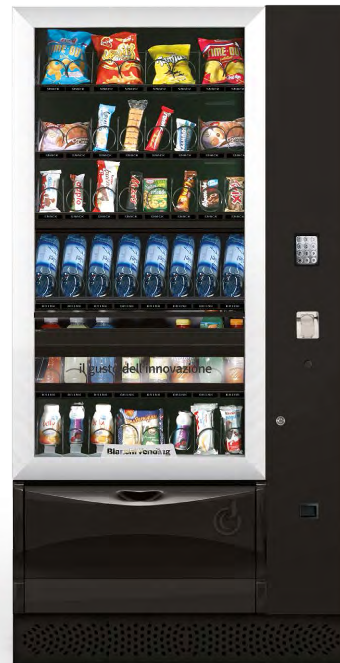
VISTA PLUS L AVEC ASCENSEUR

UN TOP DE GAMME QUI INTÈGRE DES TECHNOLOGIES INNOVANTES POUR OFFRIR UNE GRANDE FLEXIBILITÉ ET UN SERVICE DE HAUT NIVEAU .