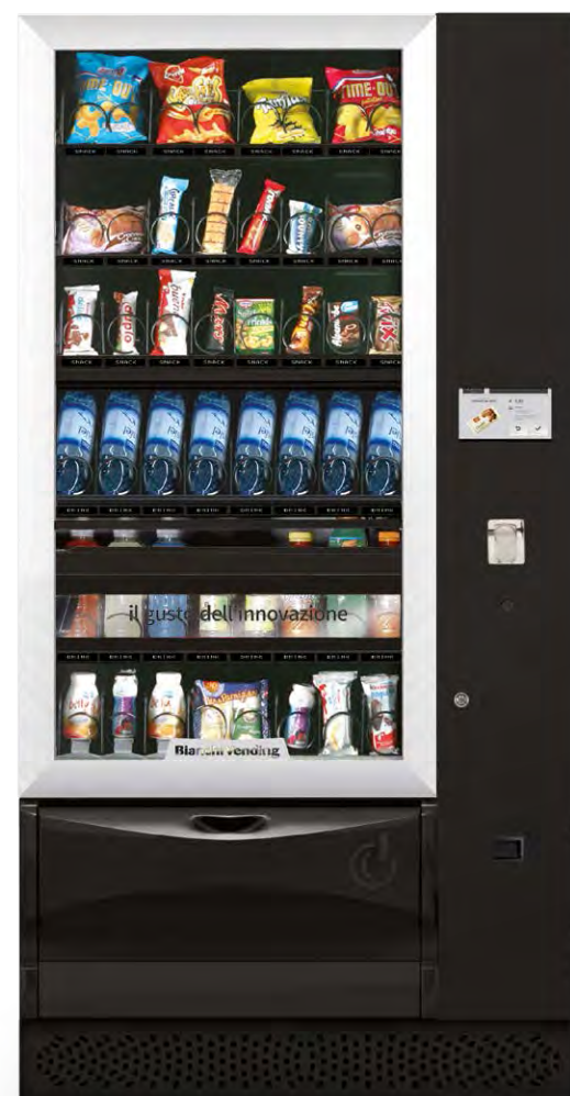
VISTA PLUS L MASTER TOUCH 7"