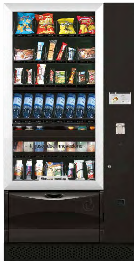
VISTA PLUS L MASTER TOUCH7"