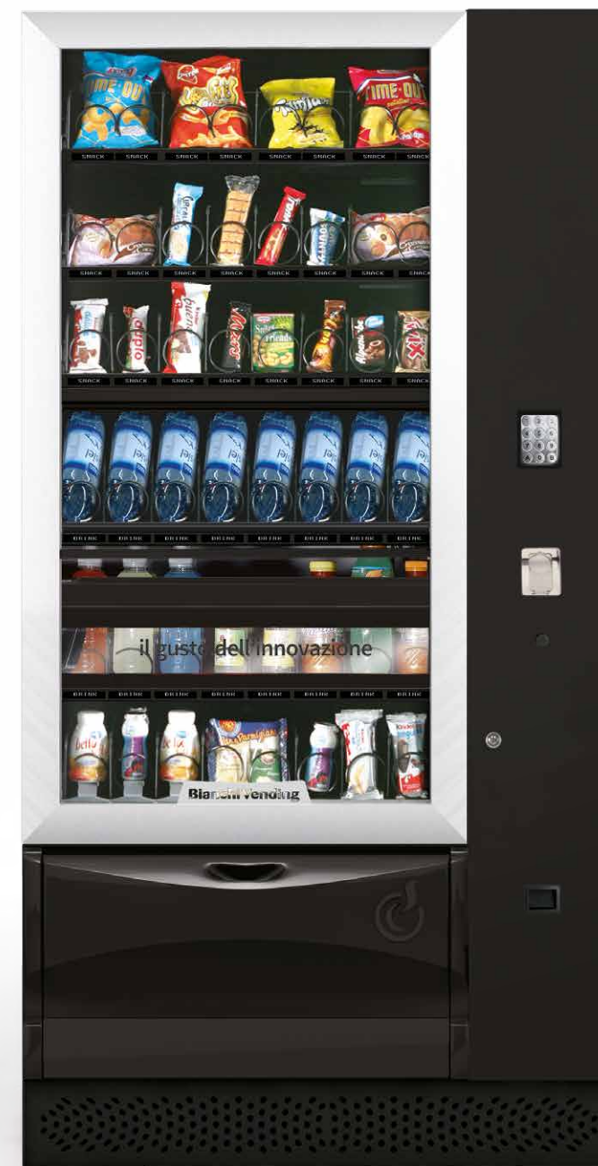
VISTA PLUS L CON ASCENSORE

EINE TOP BANDBREITE MIT INNOVATIVEN TECHNOLOGIEN UM FLEXIBILITÄT UND SERVICE AUF HÖCHSTEM NIVEAU ZU BIETEN.