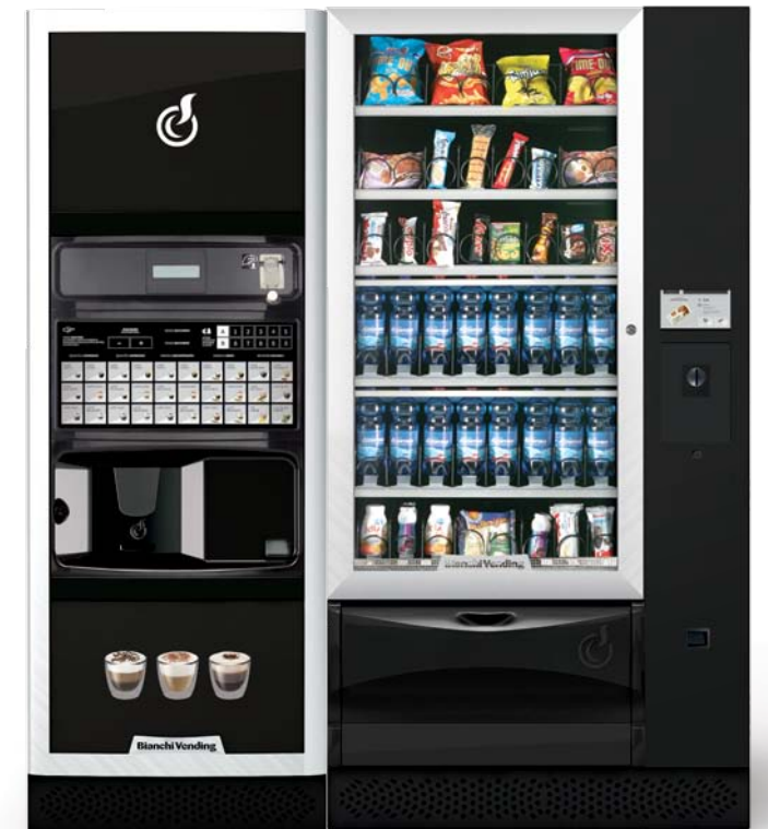
LEI700 PLUS + VISTA L MASTER TOUCH 7"

VIDEO DE ALTA CALIDAD. La tecnología de nuestro monitor LCD permite la inserción de imágenes o videos promocionales o informativos en alta calidad, lo que aumenta el grado de participación de los usuarios.