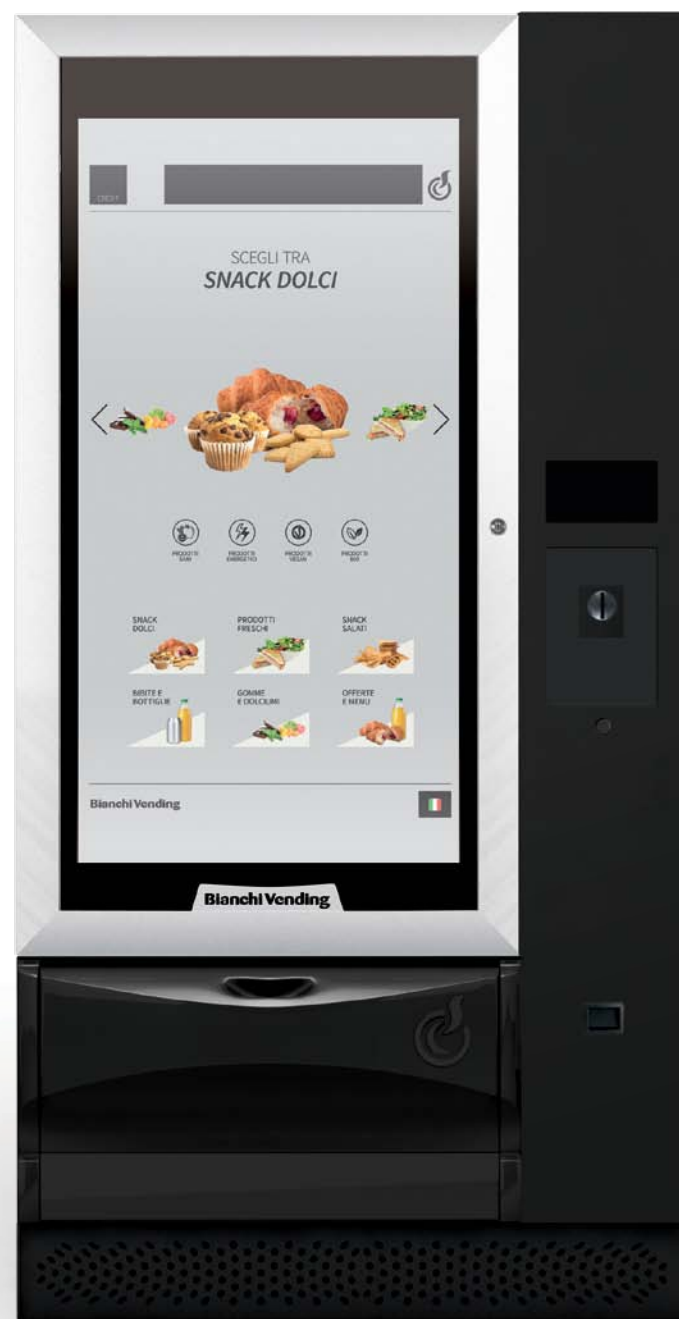
VISTA L MASTER TOUCH 46"

Un top de gama con tecnología innovadora para ofrecer flexibilidad y servicio de alto nivel.