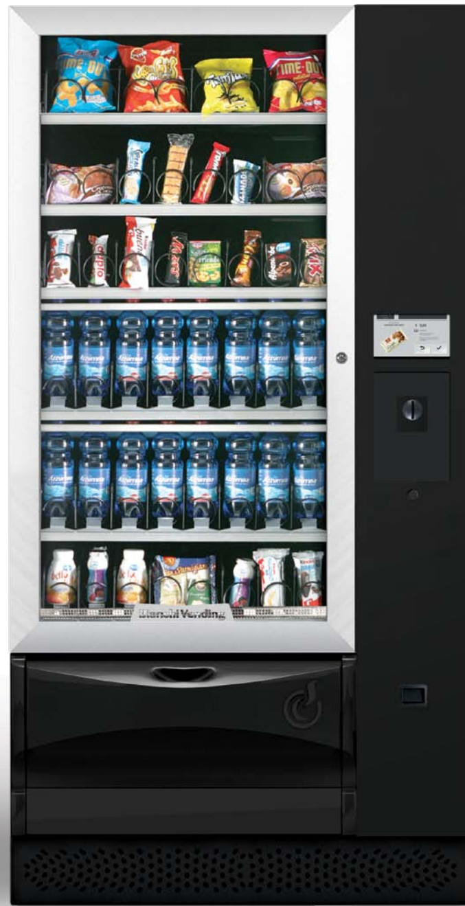
VISTA L MASTER TOUCH 7"