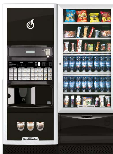
VISTA L + LEI700 PLUS

VISTA L , distributeur automatique réfrigéré à 3° pour la vente de produits snacks , sandwiches , produits frais , boîtes et bouteilles , disponible en version slave .