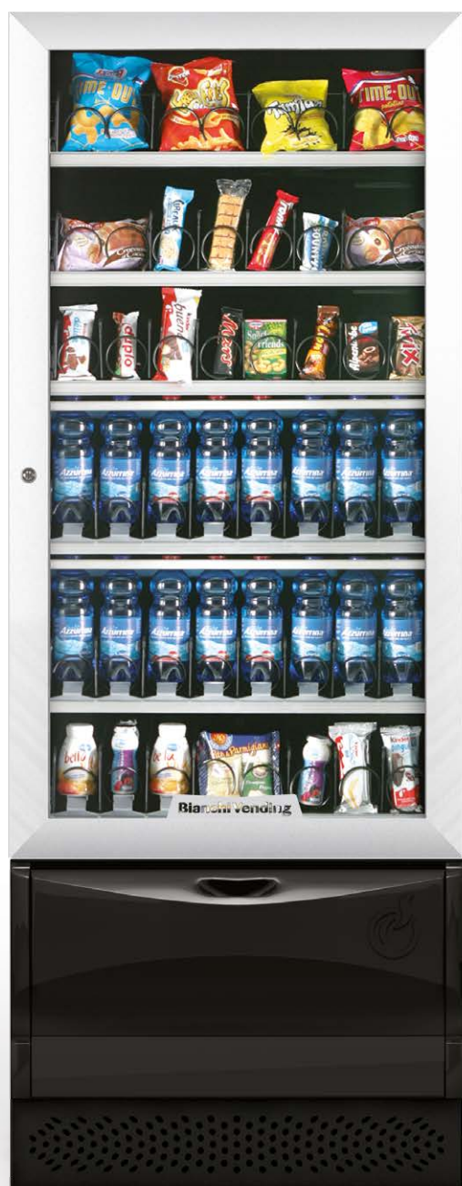
VISTA L SLAVE