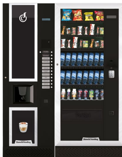
LEI600 + ARIA L MASTER

LEI600, distributore automatico per bevande calde con capacità di 600 bicchieri.