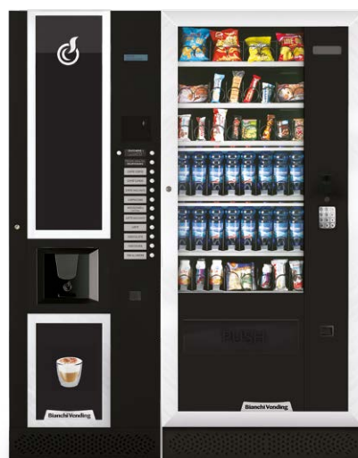
LEI600 + ARIA L MASTER