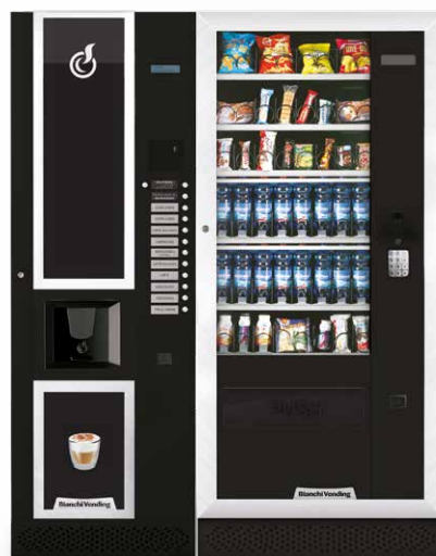
LEI600 + ARIA L MASTER

LEI600, Heißgetränkeautomaten mit einer Kapazität von 600 Bechern und mit 13 Wahlkosten, davon 3 Vorwahlen (2 für die Zuckerdosierung + 1 für Instant-Kaffee in der Standardversion).