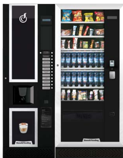
LEI600 + ARIA L MASTER

LEI600, Automatisk automat för varma drycker med kopp dispenser för 600 koppar.