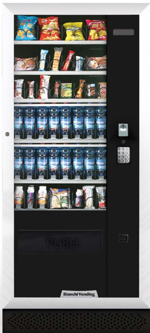
ARIA L MASTER

ARIA L, kylld 3°C varuautomat för försäljning av godis, smörgåsar, läsk, vatten, yoghurt samt andra förgängliga produkter, finns i Slave version.