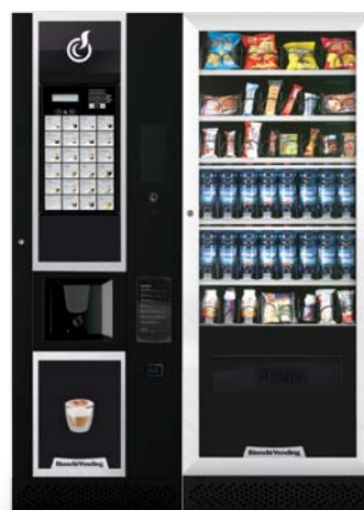
LEI600 SMART + ARIA L SLAVE