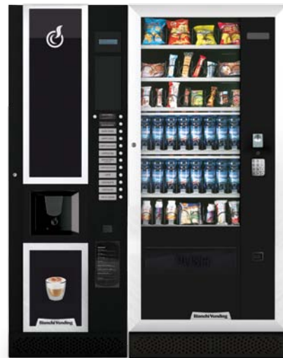
LEI600 + ARIA L MASTER

LEI600, Heißgetränkeautomaten mit einer Kapazität von 600 Bechern und mit 13 Wahlkosten, davon 3 Vorwahlen (2 für die Zuckerdosierung + 1 für Instant-Kaffee in der Standardversion).