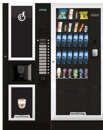
LEI400 + ARIA M MASTER

LEI400, distributore automatico per bevande calde con capacità di 400 bicchieri.