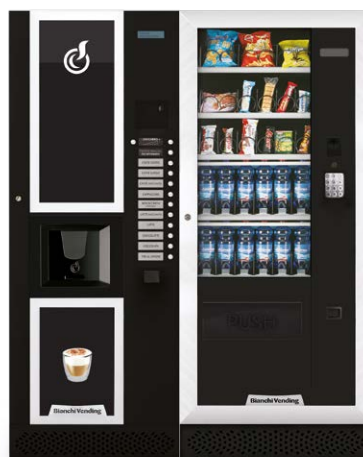
LEI400 + ARIA M MASTER