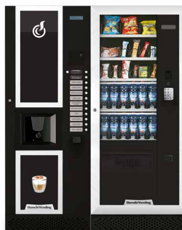
LEI400 + ARIA M MASTER