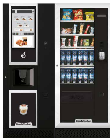
LEI400 TOUCH 21" + ARIA M MASTER