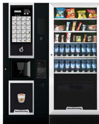
LEI400 SMART + ARIA M SLAVE