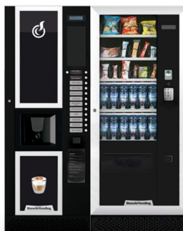
LEI400 + ARIA M MÀSTER