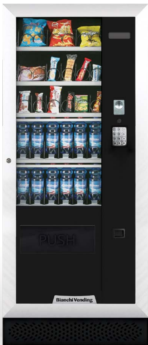
ARIA M MÁSTER

ARIA M, distribuidor automático de espirales refrigerado 3°C para la venta de snacks, bocadillos, productos frescos, latas y botellas. Disponible en versión máster o slave.