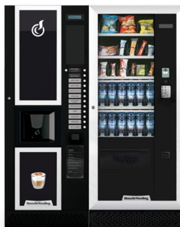
LEI400 + ARIA M MASTER