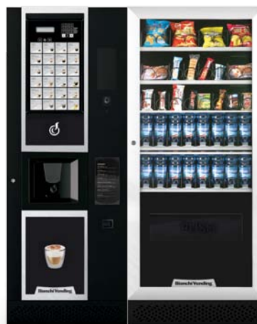
LEI400 SMART + ARIA M SLAVE