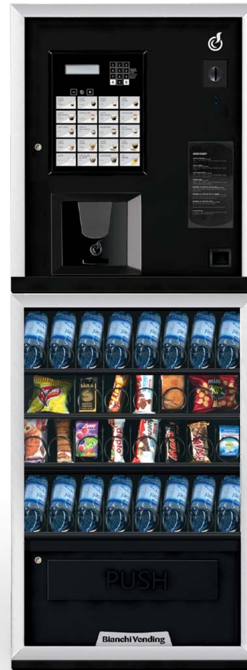
LEI300 SMART + ARIA S SLAVE