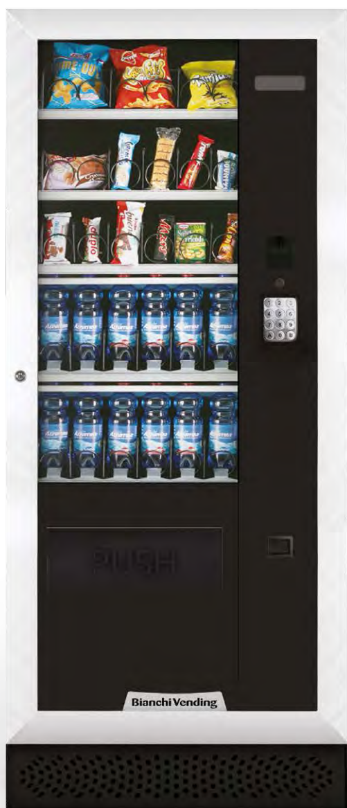
ARIA M MASTER

ARIA M , distributeur automatique réfrigéré à 3° pour la vente de produits snacks , sandwiches , produits frais , boîtes et bouteilles. Disponible en version master ou slave .