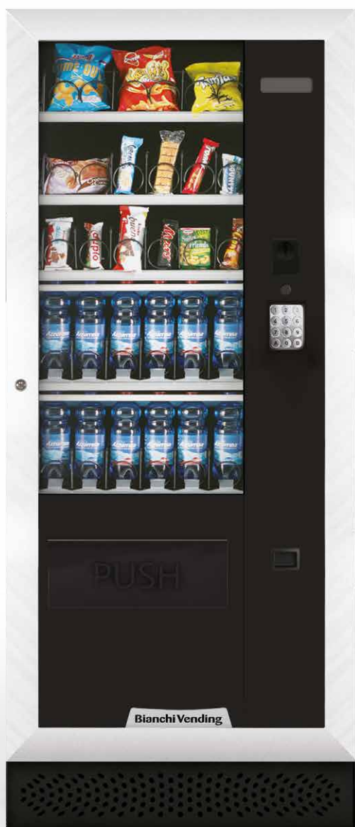
ARIA M MASTER

ARIA M, 3° C Kühlspiraleautomat für den Verkauf von Snacks, Sandwiches, frischen Produkten, Dosen und Flaschen; in den Versionen Master oder Slave verfügbar.